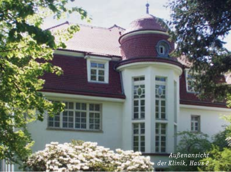
Außenansicht der Klinik, Haus 2